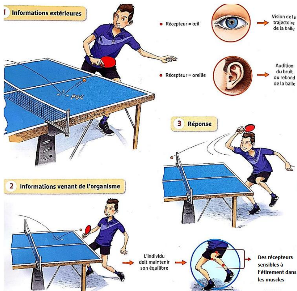
Doc 1. La perception d'informations lors d'un match de tennis de table.

Titre : Schéma montrant le contrôle nerveux de l'effort physique et la commande d'un mouvement volontaire.